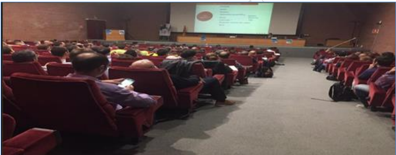
Jornadas Análisis de perfiles criminales de la EEC en el Instituto de Seguridad de Cataluña.

Este término que nos define, del latín “securitas”, implica ausencia o minimización de riesgos, en los avatares de la vida, (incluida la profesional), lo que también supone, a contrario sensu de la llegada a una situación de cero riesgos, que a pesar de que de manera insospechada y, paradójicamente, muchas son las personas y profesionales del sector, en realidad, pocos, los que en espíritu y afán de ser los mejores en su faceta formativa, la vivimos con vocación, haciendo de ella la prestación de un SERVICIO SEGURO de calidad y satisfacción.